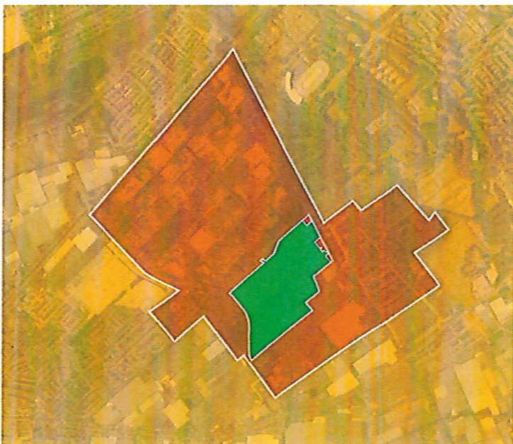
Impact op de omgeving: plangebied (groen) directe buren (rood), omgeving van het plan (oranje), overig (geel)

Het niveau van belang en invloed van alle bovenstaande stakeholders zien we als drie categorieën: Buren (1), omgeving (2), overig (3). Met de gemeente hebben wij structureel overleg via een projectteam-overleg en waar nodig informeert/consulteert de gemeente de provincie. Daarnaast zal ABC-Westland indien gewenst het college van Burgemeesters en Wethouders en de gemeenteraad actief informeren.