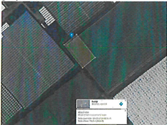
Ca. 2.000m 2 deelperceel toe te voegen aan plangebied ABC Westland Oost

Dit betreft met name de uit te geven kavel gelegen op huidige locatie Strijp Artikel 5.1 lid 2 sub e Woo Door toevoeging van een perceel van ca. 2.000m 2 van naastgelegen glastuinbouwbedrijf (reeds in eigendom van ontwikkelaar), kan zowel de uitgeefbare bedrijfskavel als de aan te leggen rondweg rond deze kavel geoptimaliseerd worden.